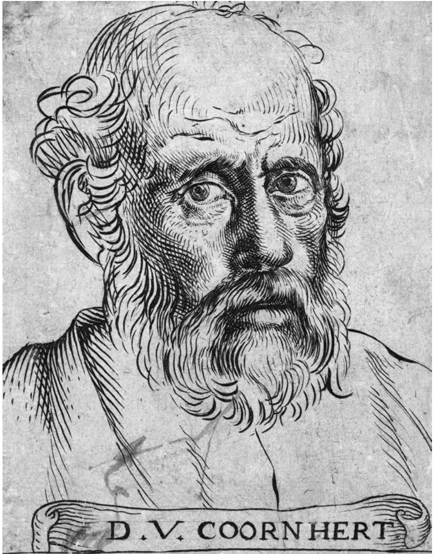
Portret van Dirck Volkertsz Coornhert. Gravure naar een ontwerp van Hendrick Goltzius, ca. 1600, Rijksmuseum, Amsterdam.