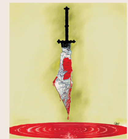
Illustratie: Rikhar Hansson

Het rapport is al eerder in VN-verband bevestigd. Op 18 oktober is van de Mensenrechtenraad het resultaat van een vergadering over de situatie in de Gazastrook bekend. Het rapport werd aangenomen met 141 stemmen tegen, 10 tegen en 41 onthoudingen. Het rapport is het resultaat van een onderzoek dat de Verenigde Staten in december 2008 en januari 2009.