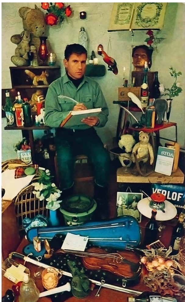
OMSLAG VAN GERARD REVES NADER TOT U, 1966

Een bijzondere categorie is in dit opzicht die van het zelfportret. Dit is vooral een interessant genre voor dubbeltalenten: in sommige gevallen wil de schilderende schrijver iets laten zien wat in het literaire werk verborgen blijft, in andere gevallen versterkt het beeld juist de literaire bedoeling, en ontstaat een poëticaal portret. Al in 1633 zond Anna Maria van Schurman bijvoorbeeld haar geëtste zelfportret – voorzien van Latijnse verzen, waarmee ze haar literaire positie claimde – naar diverse eigentijdse dichters op wie ze indruk wilde maken. François HaverSchmidt liet een gefictionaliseerd portret van zijn alter ego Piet Paaltjens, de bleke jongeling, maken, dat hij voorin zijn Snikken en grimlachjes (1867) publiceerde. De dichter J.C. van Schagen beweerde ooit de schilderkunst te prefereren boven de letteren vanwege de 'zuiverheid' van het beeld. Ondanks die uitgesproken voorkeur zorgde hij er wel voor zich te portretteren met een imposante boekenkast op de achtergrond. Jan Cremer wilde zichzelf juist helemaal niet intellectueel voorstellen aan de wereld: zijn zelfportret is opgesierd met beelden van een olielamp en een bierfles, als beknopte autobiografie van de jonge bohemien.