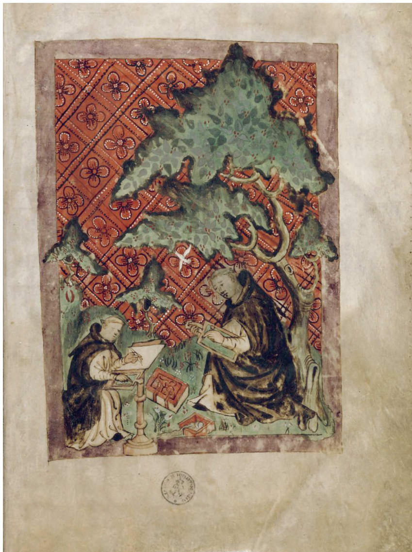
JAN VAN RUUSBROEC SCHRIJVEND ONDER EEN BOOM, HAND- SCHRIFT 19295-97, F.2. KONINKLIJKE BIBLIO- THEEK, BRUSSEL.

schrijvers, niet om een ontwikkeling van literaire werken – het is een andere manier om het verhaal van de Nederlandse literatuurgeschiedenis te vertellen. Althans, van vrijwel de hele Nederlandse literatuurgeschiedenis, want de vroegste periode is hier afwezig. Auteurschap was in de middeleeuwen vaak anoniem. Wie schreef Karel ende Elegast , Beatrijs , Mariken van Nieuweghen ? Er zijn vaak geen namen overgeleverd, laat staan auteursafbeeldin-