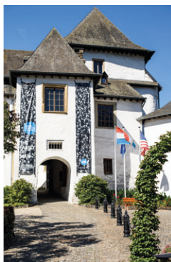
↑ Middeleeuws kasteel van Clervaux