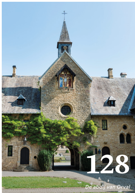
De abdiij van Orval