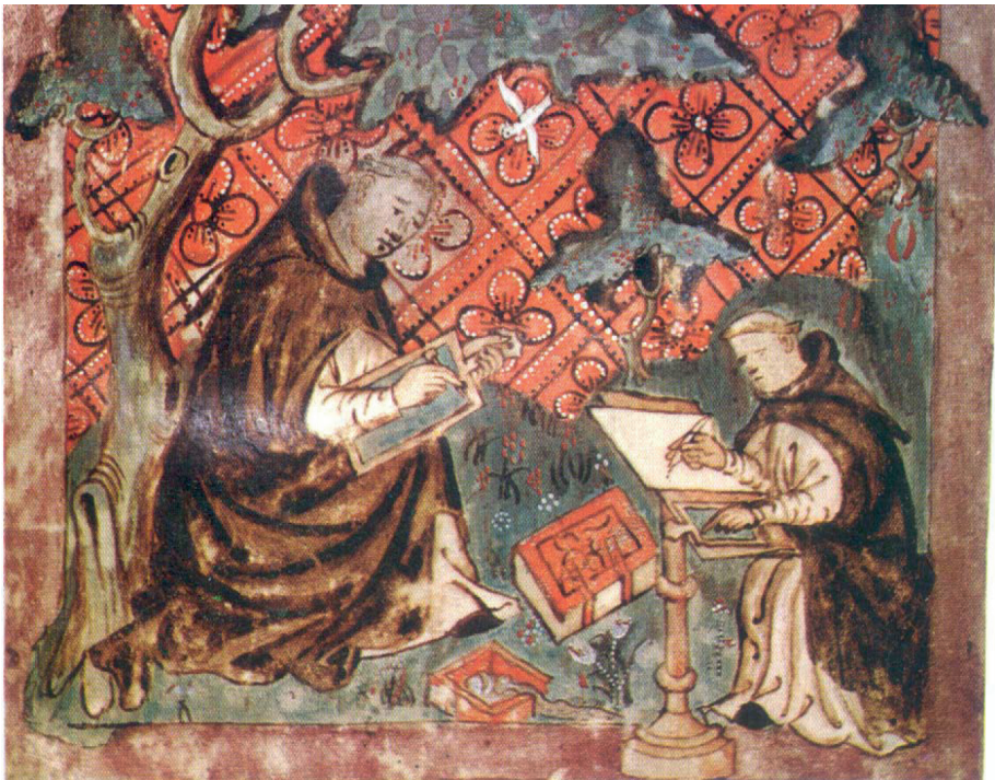
lb. Miniatuur met Jan van Ruusbroec, Koninklijke Bibliotheek Albert I, Brussel, codex 19.295-97, fol. 2 vers. Jan van Ruusbroec schrijft op een wastablet terwijl een andere monnik een tekst op perkament kopieert. Tussen de beide geestelijken ligt een codex als resultaat van het schrijfwerk.