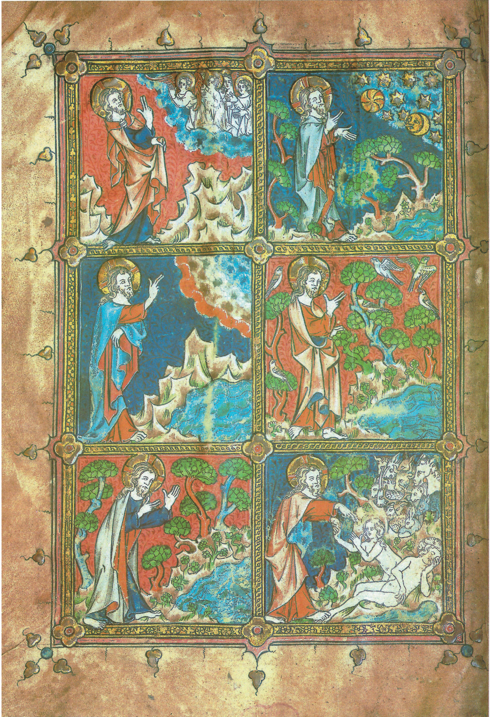
II. Jacob van Maerlant, Rijmbijbel , Museum Meermanno, Den Haag, codex 10 B 21, fol. 1 vers.