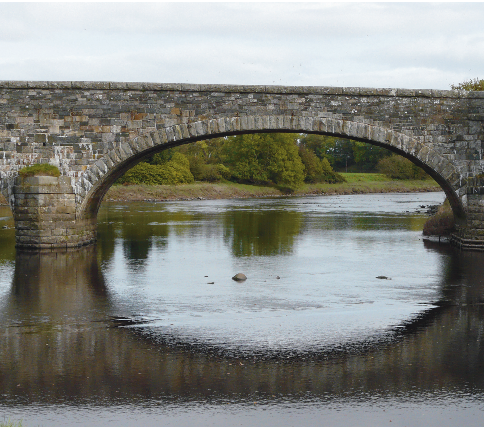
De Bladnoch rivier