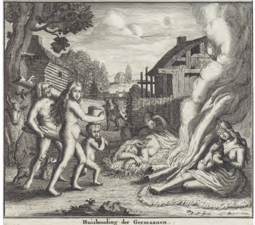
Huishouding der Germaanen.

Er is in het verleden al vastgesteld dat de oevers van de Amstel geschikt moeten zijn geweest voor bewoning in de Romeinse tijd. De amateur-archeoloog H. de Raaf schreef in 1962 (in het maandblad Amstelodamum ) dat Amsterdam gelegen was aan het zogenaamde Oer-IJ, een druk bevaren water in de Romeinse tijd. Het is de waterweg die genomen werd