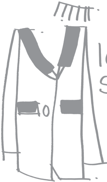
Foto van m'n outfit net snel nog even op mijn Lookbook gezet, met tijgermasker. Heb ik vanmiddag lekker veel reacties, hoop ik. Meestal krijg ik veel Hypes. Ik heb ook een keer op de facebookpagina van Lookbook gestaan, maar dat was vast omdat ze mij

Oké. Ik doe mijn etui en telefoon in mijn enveloptas en de boeken in de juten eco-shopper van de АН. Voilà, nonchalant en milieubewust. En ik heb met viltstift een hartjestraan op mijn pols getekend, zodat oma bij me is vandaag.