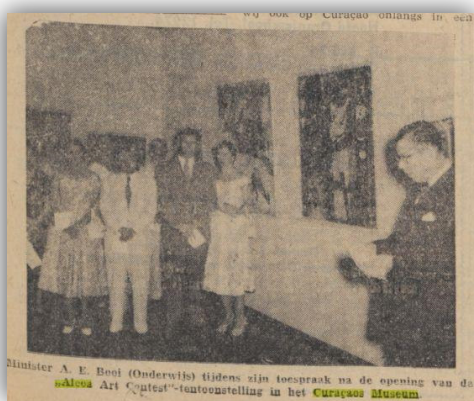
Opening tentoonstelling Alcoa Art Contest in het Curaçaosch Museum.