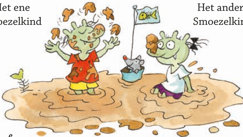
Het andere Smoezelkind