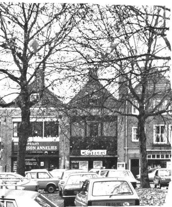
Geboortehuis en winkel van mijn ouders

Voor vakanties waren de mogelijkheden schaars. Er was te weinig geld en wanneer we al een week op vakantie gingen naar bijvoorbeeld Zuid-Limburg, dan ging de winkel dus dicht, hetgeen ook betekende dat er in die week