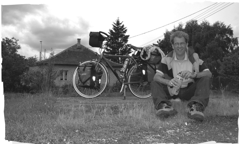
Tokaj - Hongarije

Eenmaal in Hongarije blijkt dat ieder gemeentehuis en bibliotheek is voorzien van een internetaansluiting en met in ieder geval een openbaar te gebruiken pc. In de meeste gevallen is daar ook wifi te gebruiken.