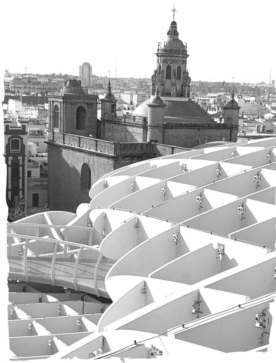
Setas de Sevilla