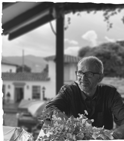
Pueblito Paisa Medellin – Colombia

Je wordt niet van de ene op de andere dag een wereldburger. Het is een ontstaansproces van maanden en in mijn geval zelfs van vele jaren. Ik ben ook nooit bewust begonnen met wereldburger zijn. Op het moment dat ik het besluit nam om locatie onafhankelijk te willen werken, bestonden termen als 'digitale nomade' en 'slow traveller' nog niet eens. Het waren volstrekt onbekende fenomenen, laat staan dat ik die kon nastreven. Ik wilde pendelen tussen meerdere locaties op de wereld en vanuit daar mijn werk kunnen doen. Ik wist dat ik dat met of via het internet kon realiseren. Dat was alles op dat moment.