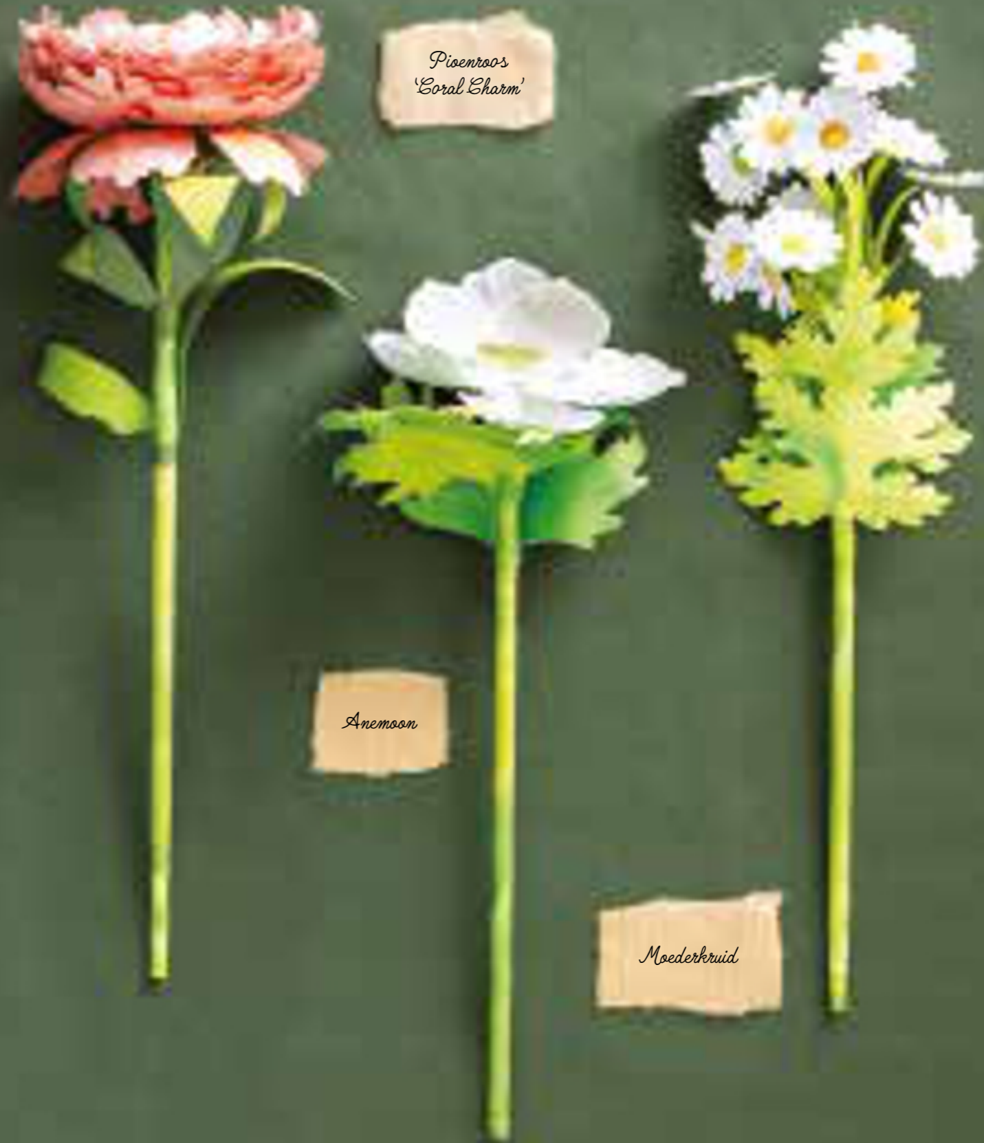
Pivoenros 'Coral Charm'