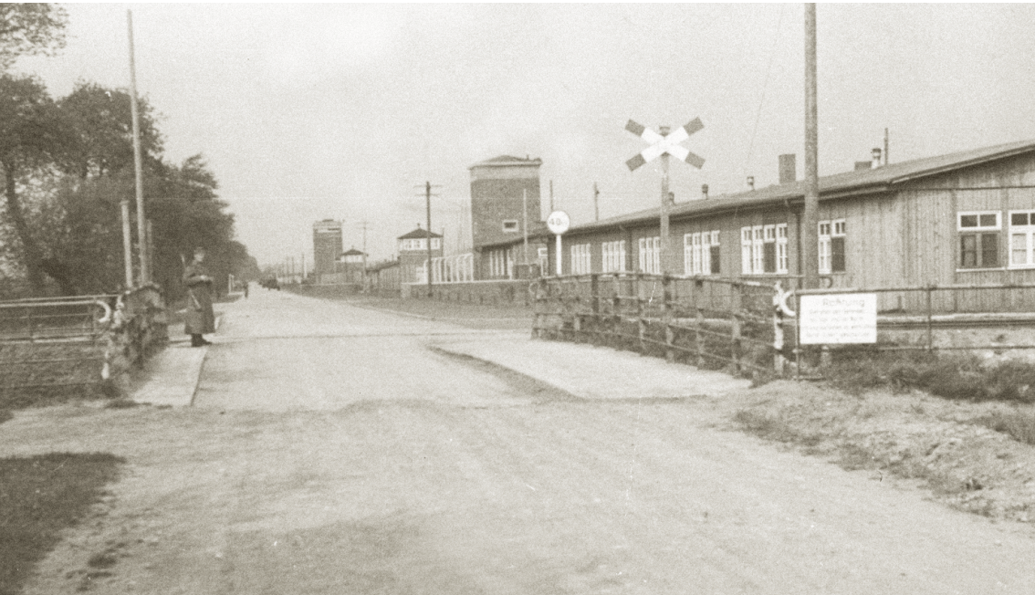
Toegangsweg naar het concentratiekamp

Om de tien minuten moesten vijftig mannen naar buiten, en als dat niet snel genoeg ging, mepten de bewakers ze de kelder uit. Dat waren geen SS'ers, maar ook gevangenen, met een groene