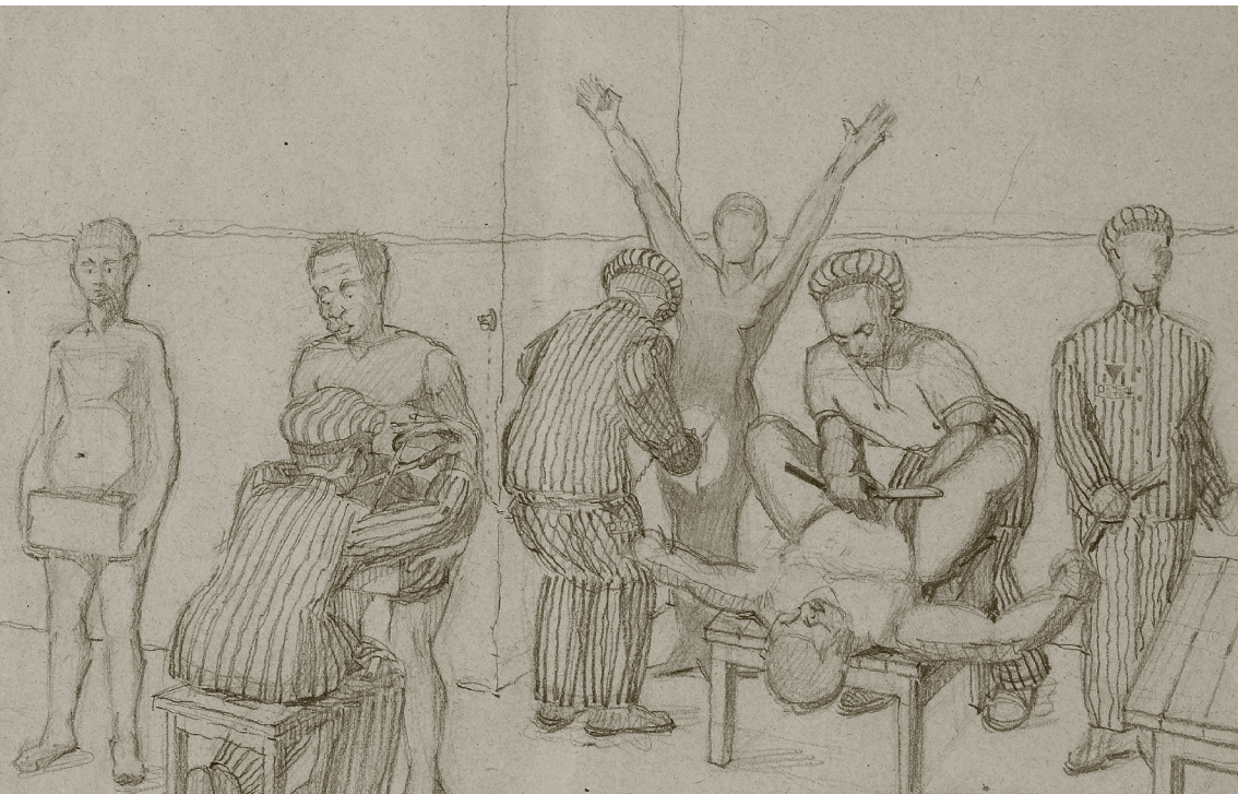
Het ontdoen van alle lichaamsbehering

Wim bloedde over zijn hele lichaam. Toen een andere gevangene hem insmeerde met desinfecterende Lysol, kon hij het wel uitschreeuwen. Hij beet op zijn lip en ontweek een zwaai met een knuppel van een bewaker die het allemaal weer te lang duurde. Snel door naar de volgende ruimte.