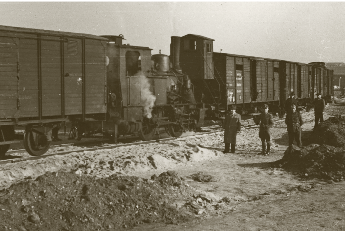
Deel van het ontvangstcomité in Neuengamme

Tijd om lang daar bij stil te staan was er niet. De sirenes van het luchtalarm loeiden en de bewakers vluchtten opnieuw de trein uit. Net als de andere gevangenen kon Wim weinig anders