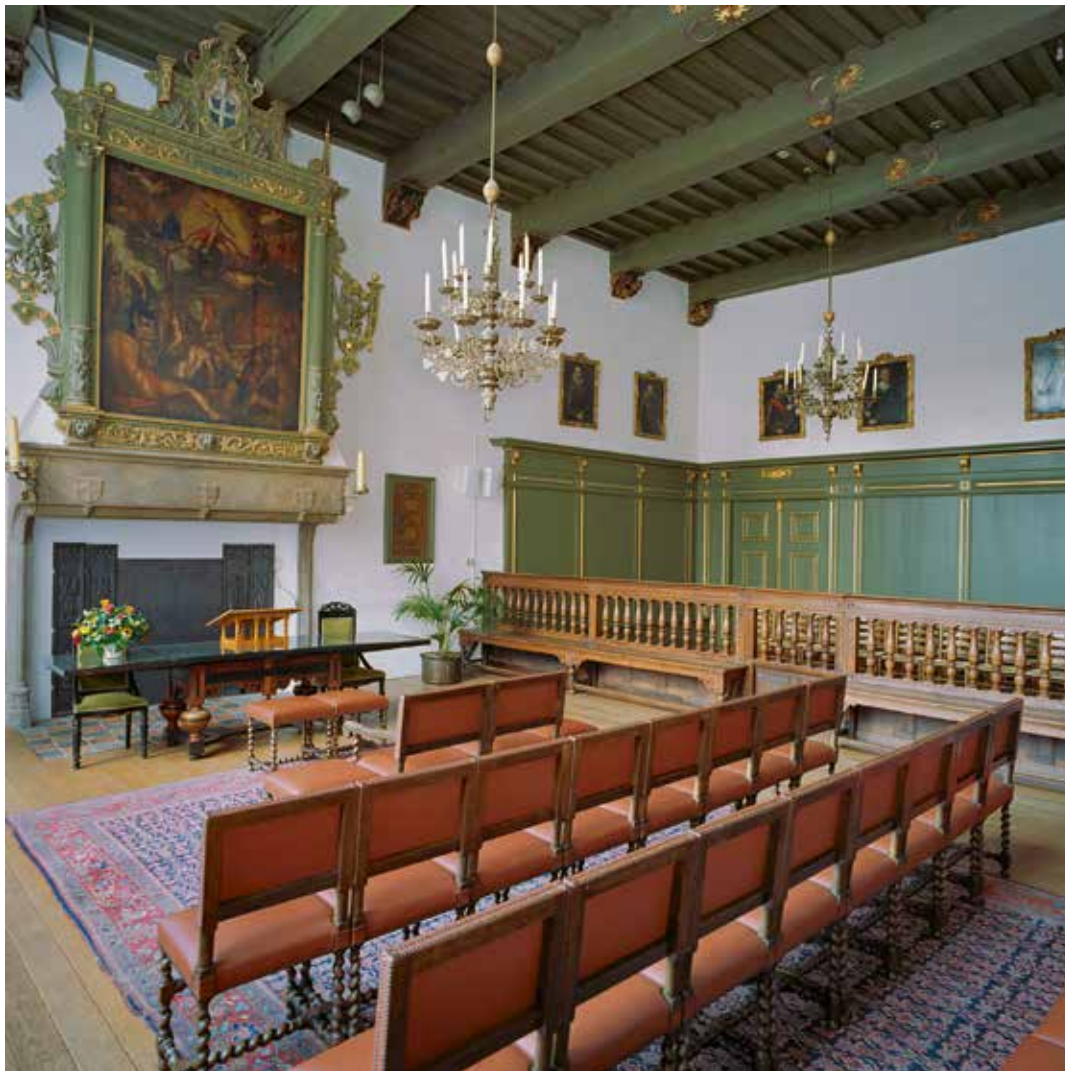
De Zwolse magistratuur vergaderde in de huidige Schepenzaal, die nu onder meer als trouwlocatie dienst doet.