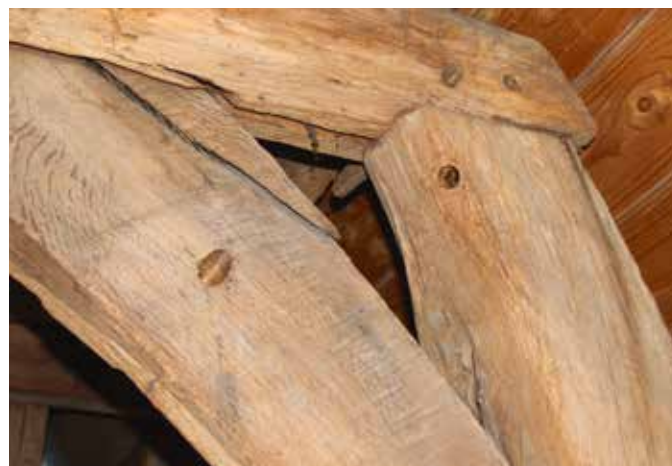
In deze oude balken op de zolder aan de Melkmarkt zitten twee gaten, waaruit met een holle boor houtmonsters voor dendrochronologisch onderzoek zijn genomen.

Afgezien van een enkele jaarringdatering is de ontstaansgeschiedenis van het rijksmonument net zoals bij veel historische gebouwen in mist gehuld. Een van de oorzaken is dat perkamenten en papieren bronnen uit de middeleeuwen schaars zijn. De administratieve ontwikkeling van de stad Zwolle stond in dit tijdperk nog in de kinderschoenen. Vergeleken met vandaag de dag werd er maar weinig schriftelijk vastgelegd, terwijl ook veel documenten verloren zijn gegaan. Het spaarzame archiefmateriaal maakt het moeilijk om een helder zicht te krijgen op de vervlogen leefwereld van onze verre voorouders. We moeten het doen met sporadische, vrij willekeurig bewaard gebleven puzzelstukjes, die hoogstens een tip van de sluier oplichten. Gelukkig kan het gemis aan geschreven getuigenissen soms worden gecompenseerd door bouwhistorisch onderzoek. Achter talloze in de loop der tijd gemoderniseerde gevels gaan eeuwenoude bouwsporen schuil in de vorm van funde-