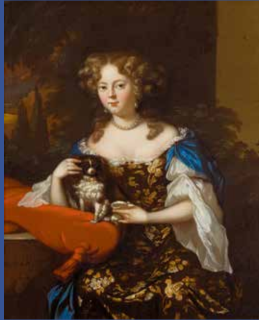
Twee door Aleijda Wolfsen geschilderde portretten. Het linker schilderij hangt in het Vrouwenhuis, het rechter in het op een steenworp afstand gelegen museum ANNO.