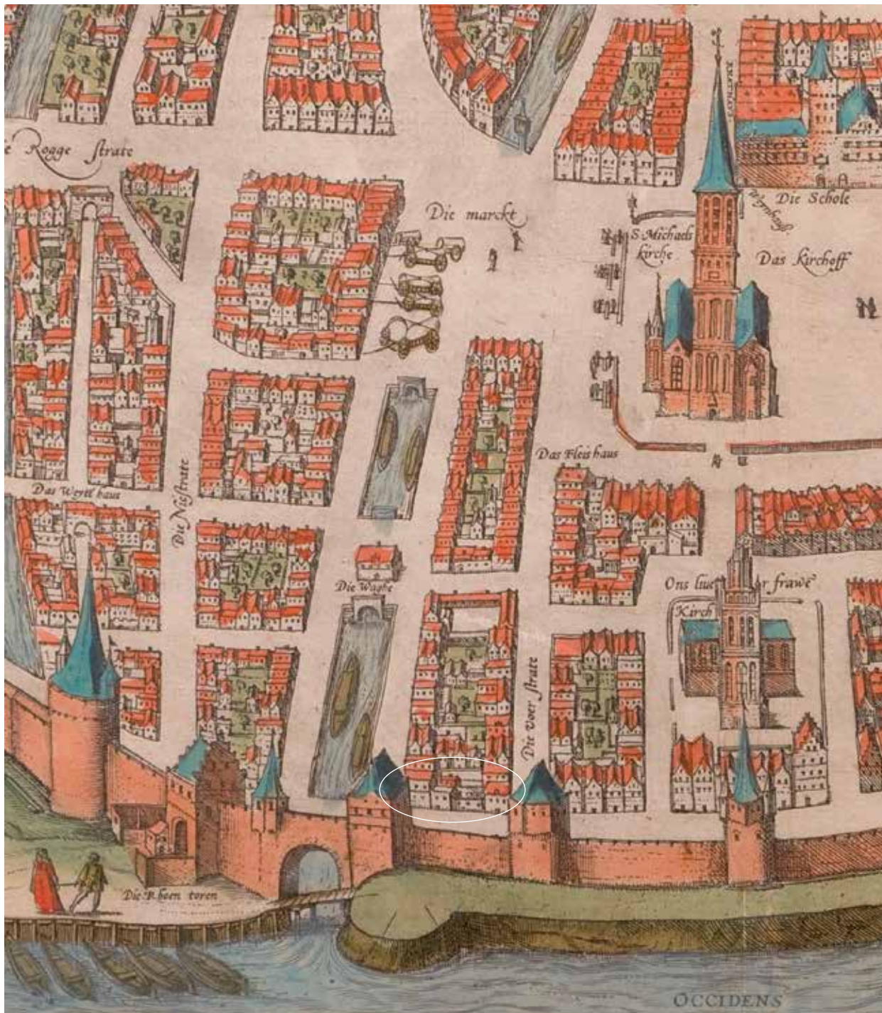
Op dit fragment van een omstreeks 1580 door de in Keulen werkzame cartografen Georg Braun en Frans Hogenberg vervaardigde plattegrond van Zwolle is de locatie van het tegenover de westelijke stadsmuur gelegen complex van het huidige Vrouwenhuis omcirkeld. Hoewel de weergave zeker op detailniveau niet helemaal betrouwbaar lijkt, komt de afbeelding aardig overeen met de historische hoofdopzet van de diverse bouwdelen. Links naast de waterpoort aan de monding van de Grote Aa ligt de Rode Toren.