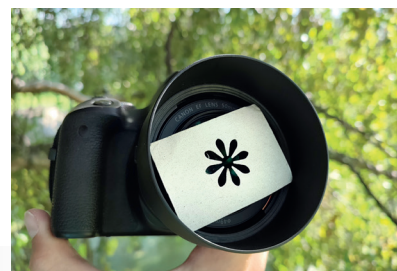
Zet een uitgeknipt vormpje voor je lens en experimenteer met bokeh-vormen! Wouter; Canon 800D + EF 50mm f/1.8 STM op 1/200s bij f/1.8; ISO 100.