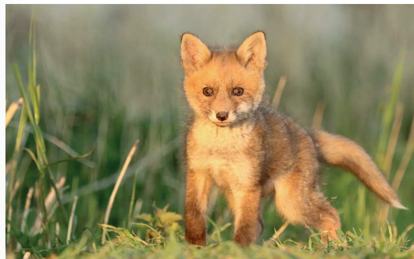
Vosje gefotografeerd tijdens het gouden uurtje. Sanne, 1 mei; Canon EOS 800D + Canon 100-400mm f/4.5-5.6L op 400mm; 1/800s bij f/6.3; ISO 3200.