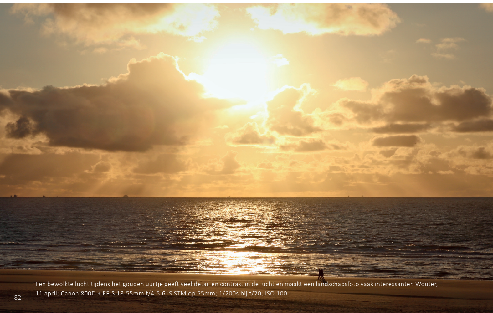
Een bewolkte lucht tijdens het gouden uurtje geeft veel detail en contrast in de lucht en maakt een landschapsfoto vaak interessanter. Wouter, 11 april; Canon 800D + EF-S 18-55mm f/4-5.6 IS STM op 55mm; 1/200s bij f/20; ISO 100.

Het gouden uur is is hét moment met het perfecte licht. Het licht is niet te fel en zorgt voor veel sfeer in je foto's. Het gouden uur vindt plaats in het uur na de zonsopgang en het uur voor de zonsondergang. Hoe kun je optimaal gebruikmaken van deze twee momenten op de dag?