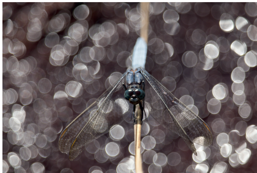
Door een achtergrond te kiezen met veel lichtpuntjes, zoals hier een drooggevalle modderbodem, kun je heel duidelijke 'bolletjes' creëren! Wouter, 2 augustus; Canon 800D + EF-S 55-250mm f/4-5.6 IS STM op 250mm; 1/400s bij f/5.6; ISO 125.

De eerste stap om deze bolletjes-bokeh te krijgen, is het opzoeken van een geschikte achtergrond. In deze achtergrond moeten kleine, lichte puntjes te vinden zijn. Dit kan bijvoorbeeld bij een wateroppervlak waar de zon op schijnt of een bladerdak waar licht doorheen valt. Als je scherpstelt op een onderwerp voor deze achtergrond wordt elk lichtpuntje een bolletje! Het is belangrijk dat er niet te veel lichtpuntjes bij elkaar zijn, want dan worden de afzonderlijke bolletjes veel minder duidelijk. Ze versmelten dan namelijk tot een lichte vlek.