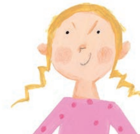
Peggie en Meggie