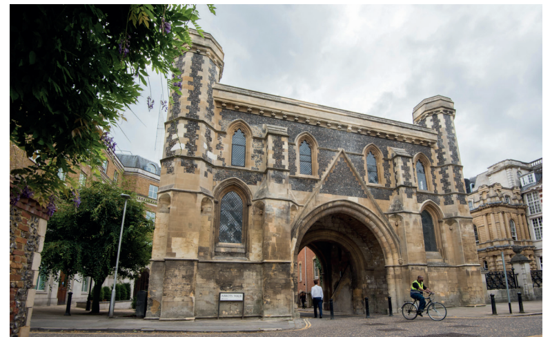
De Abbey Gateway in Reading, waar de school van Mrs La Tournelle naast stond.

De meisjes leerden in Abbey House School schrijven, spellen, geschiedenis, Frans, aardrijkskunde, tekenen, muziek, dansen en een klein beetje