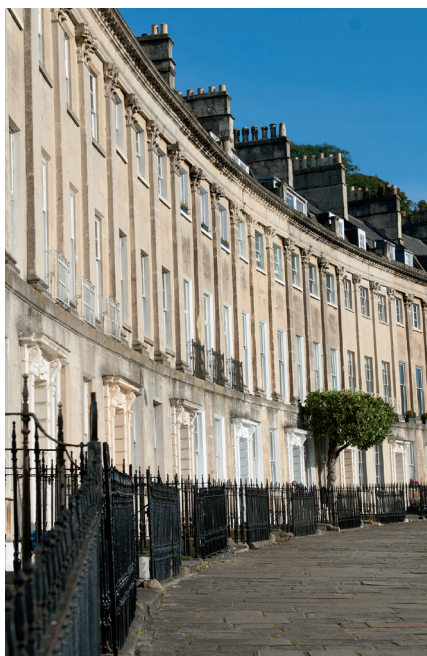
Het halve maanvormige Camden Crescent, waar Sir Walter Elliot uit Persuasion verblijft.