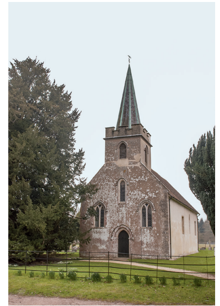
De St Nicholas Church is niet veel veranderd sinds Janes tijd.

Nergens voelde Jane zich zo thuis als in het graafschap Hampshire. De zachte glooiing van het land, de uitgestrekte weides en de knusse dorpjes gaven haar de rust om haar schrijverschap te ontwikkelen. Opvallend is dat geen van haar boeken zich afspeelt in Hampshire. Jane hield al haar personages topografisch op afstand. Misschien om te voorkomen dat iemand uit haar omgeving zich in een Elizabeth Bennet, Anne Elliot of Fanny Price zou herkennen. Of misschien om haar eigen anonimiteit te bewaren. Want wie kon vermoeden dat die populaire schrijfster, van wie zelfs de prins-regent fan was, in een klein dorpje in Hampshire woonde?