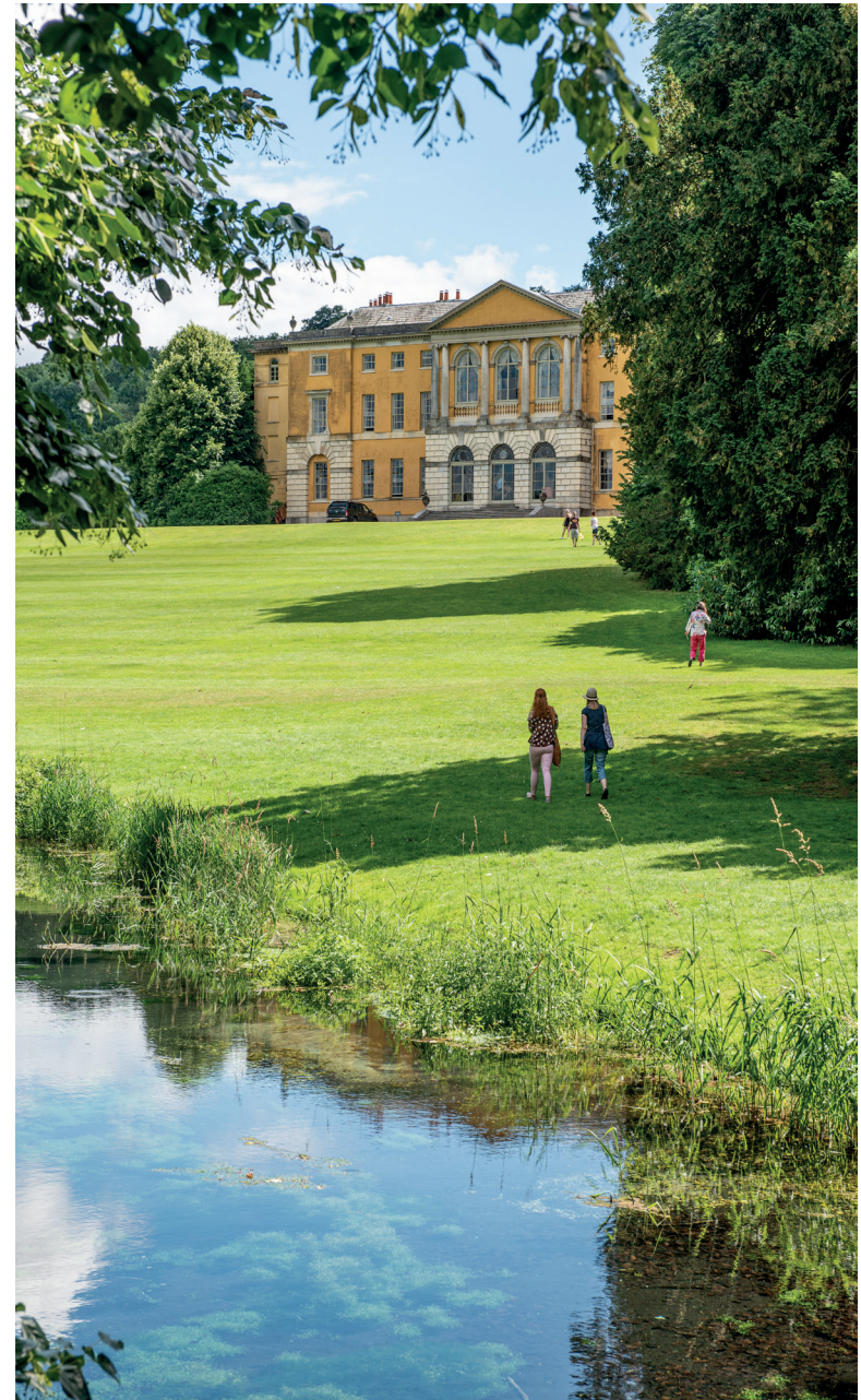
West Wycombe Park is in maar liefst vier Austen-gerelateerde producties te zien.

Het ouderwetse roodstenen West Wycombe House beviel de tweede baronet maar niets, dus verbouwde hij het stukje bij beetje naar eigen ontwerp in