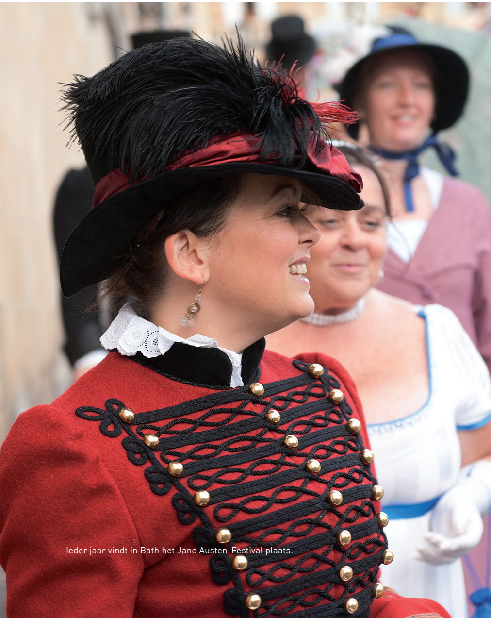
Ieder jaar vindt in Bath het Jane Austen-Festival plaats.

Je maakt het niet direct op uit haar boeken, maar Jane Austen leefde in een roerige periode uit de Britse geschiedenis. Het is haar vaak verweten dat ze voorbijging aan de grote vraagstukken uit haar tijd. Maar wie tussen de regels door leest, ziet dat ze wel degelijk op de hoogte was van wat er in de wereld gebeurde. In Mansfield Park haalt ze slavernij aan, in Persuasion krijgen we een inkijkje in de wereld van de marine. En de militie in Pride and Prejudice vertrekt niet voor niks van Meryton naar de kustplaats Brighton – aartsvijand Frankrijk lag altijd op de loer.