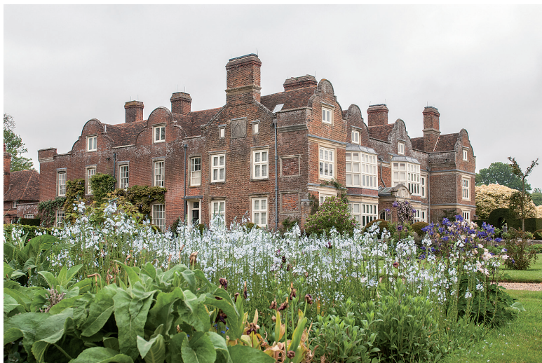
Godinton House, het landhuis van de Tokes.

De pastorie werd gebouwd in 1746, een mooi voorbeeld van Georgian architectuur. Het huis is bewoond en niet open voor publiek.