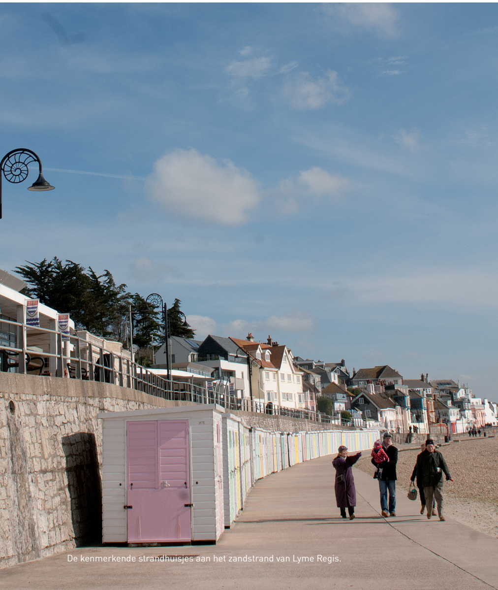
De kenmerkende strandhuisjes aan het zandstrand van Lyme Regis.

De Austens hielden ervan op vakantie te gaan. In de eerste jaren dat ze in Bath woonden, gingen ze naar de zuidkust – naar het pittoreske Lyme Regis en naar opkomende badplaatsen als Sidmouth en Teignmouth. Voor zover bekend is Jane niet verder oostwaarts geweest. Maar Saltram House, met zijn dubbele Austen-connectie, en filmlocaties als het schilderachtige Charlestown en Colyton zijn de moeite van het doorreizen waard.