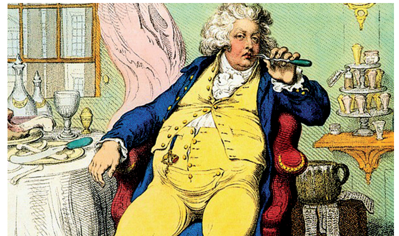
De prins-regent was een verkwistende losbol.

De prins-regent leek in niets op zijn vader. Hij was een verkwistende losbol, een ijdelruit en rokkenjager. Hij trouwde met prinses Caroline van Brunswijk omdat zijn vader hem had beloofd dat hij dan zijn schulden zou afbetalen. Het was een ongelukkige match: de prins-regent en Caroline konden elkaar niet uitstaan. Ze kregen één kind, prinses Charlotte, die trouwde met de toekomstige koning van België, Leopold van Saksen-Coburg. Hun eerste kind, een zoon, werd dood geboren en Charlotte overleed een dag later in het kraambed.