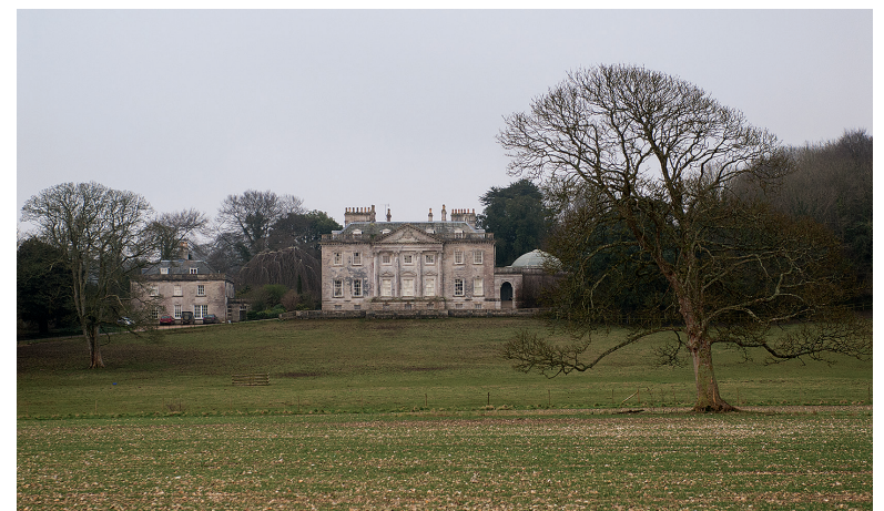
Came House is in Emma (1996) te zien als Hartfield, het huis van Emma Woodhouse.

Came House is niet geopend voor publiek, maar kan wel vanaf een openbare weg worden bewonderd. Het huis is gebruikt in de film Emma (1996) als Hartfield, het huis van Emma Woodhouse (Gwyneth Paltrow). Came (spreek uit 'kem') House