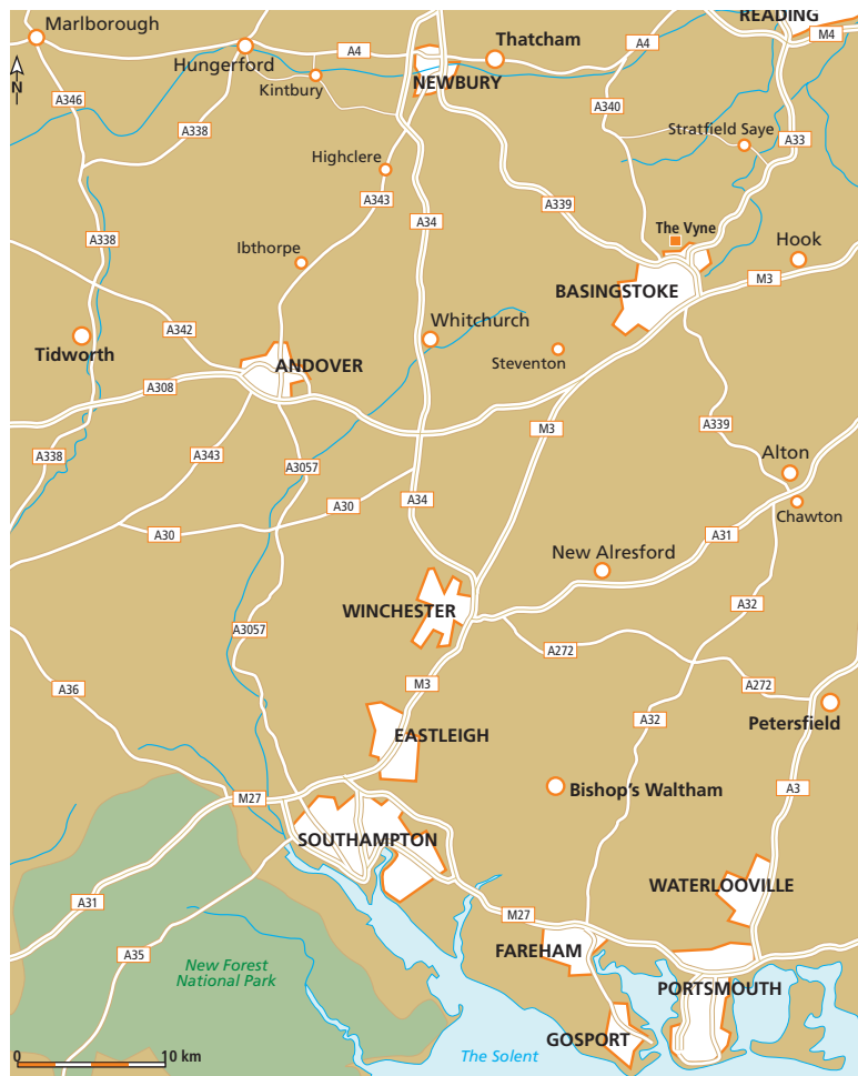
Hampshire en omgeving