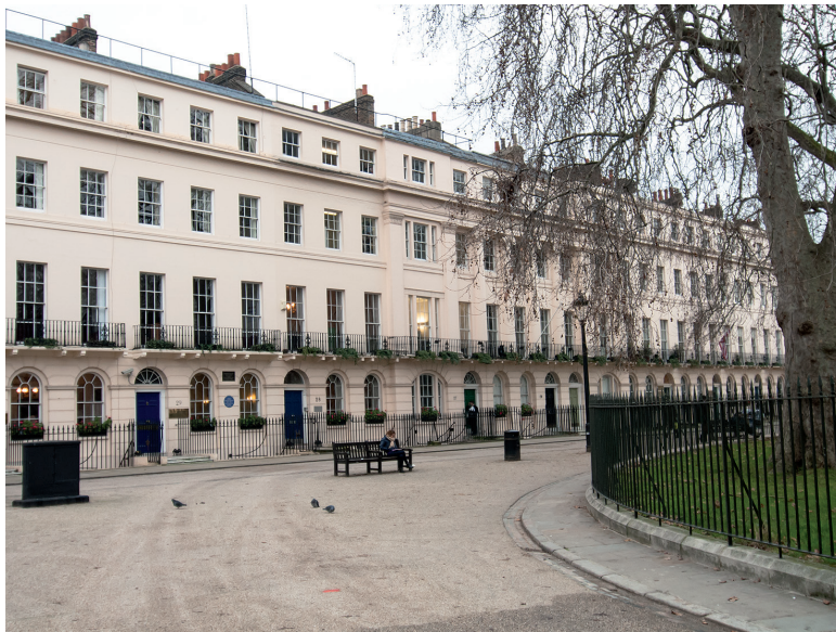
Fitzroy Square is een mooi en rustig plein met Georgian bebouwing.

vervangen door de huidige kerk, een ontwerp van Thomas Hardwicke. In 1885 kreeg de kerk zijn huidige interieur.