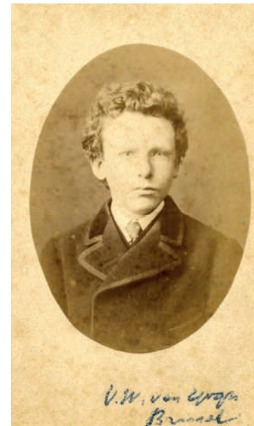
Vincent op 15-jarige leeftijd in Parijs, 1866

A= nummer op de betreffende plattegrond. B= coördinaten opnamepositie of object. C= paginanummer foto grootformaat historische foto. D= historische foto. E= opnamejaar historische foto. F= paginanummer foto grootformaat actuele foto. G= actuele foto. H= huidige adres.