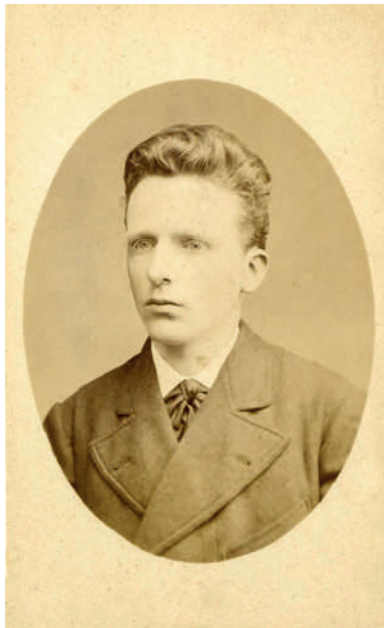
Theo van Gogh in 1876 op 19-jarige leeftijd

“ ‘t Is een mooie stad hier” , schreef Vincent. Zijn openhartige brieven aan zijn jongere broer Theo over de mensen in zijn omgeving, de gebouwen in de stad en de rijkdom van kunst vormen het uitgangspunt voor dit fotoboek. De fotograaf is op dezelfde plek gaan staan waar vroeger, vaak meer dan een eeuw geleden, iemand gegrepen werd door een bepaald gebouw of straat in Amsterdam.