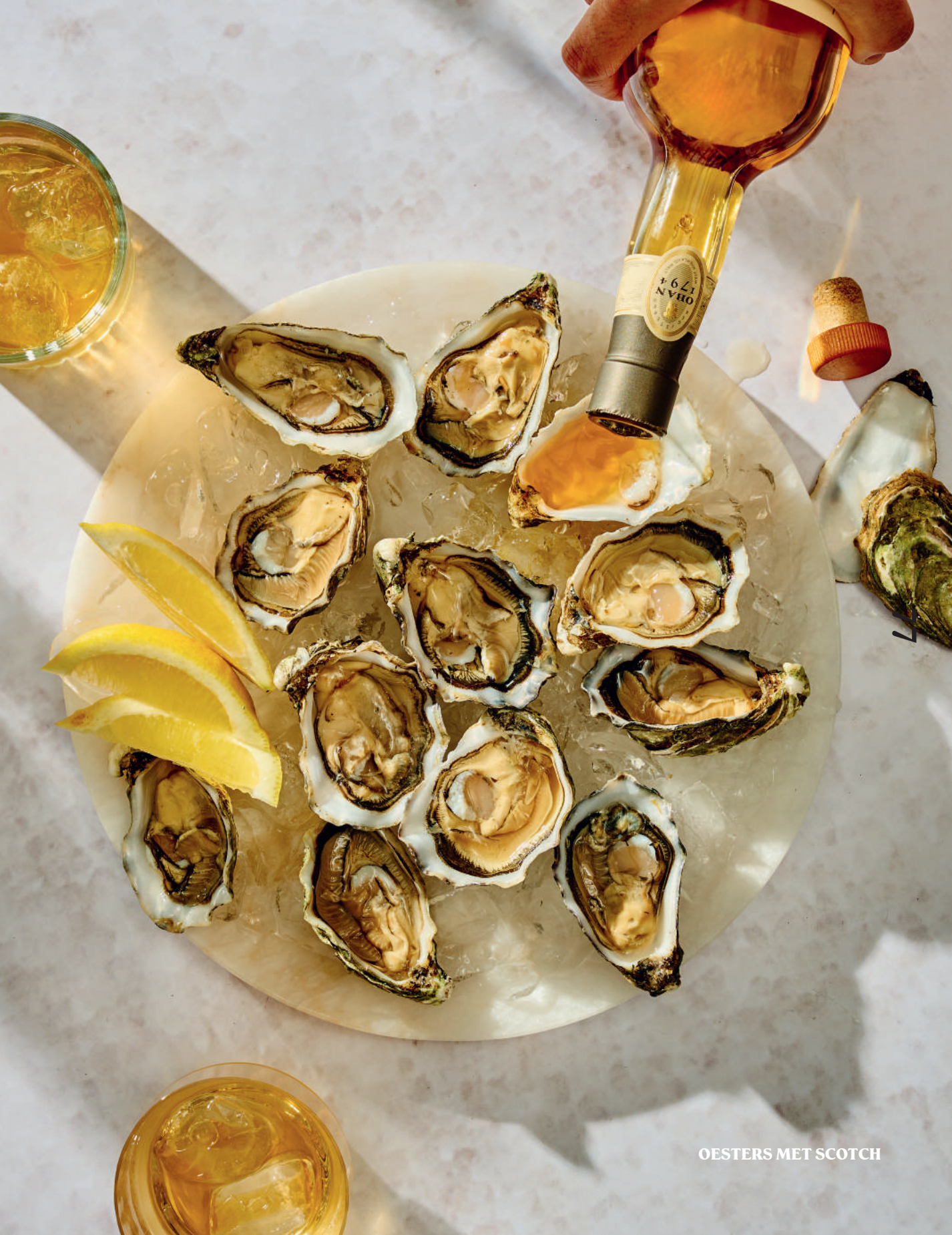
OESTERS MET SCOTCH