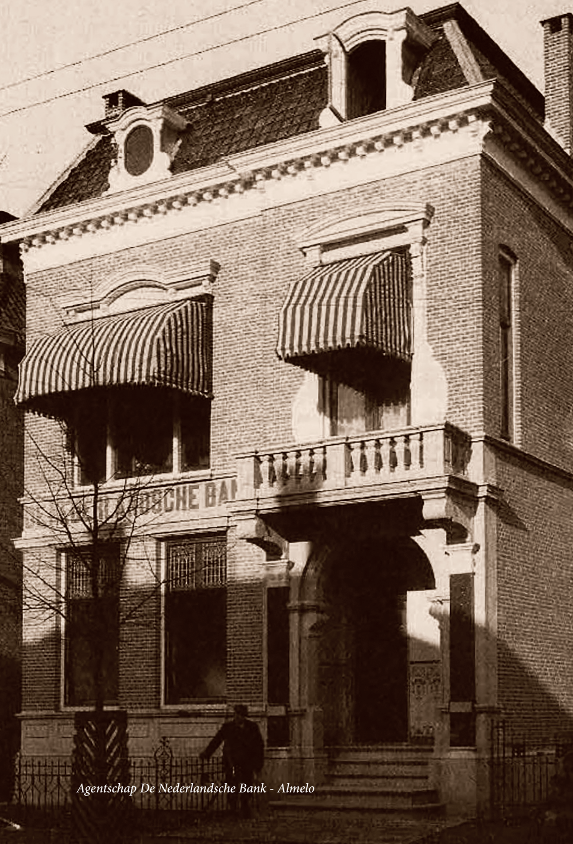
Agentschap De Nederlandsche Bank - Almelo