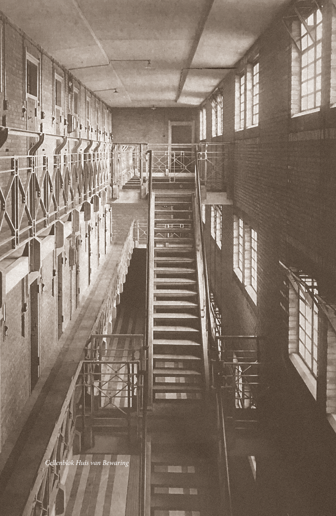
Cellenblok Huis van Bewaring