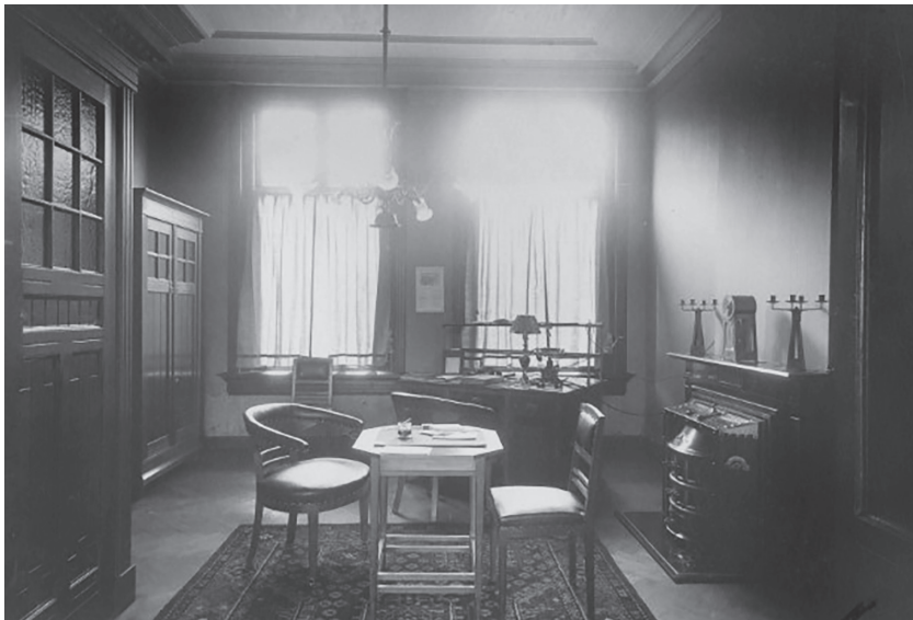
Agentenkamer met bureau rechtsachter in de hoek