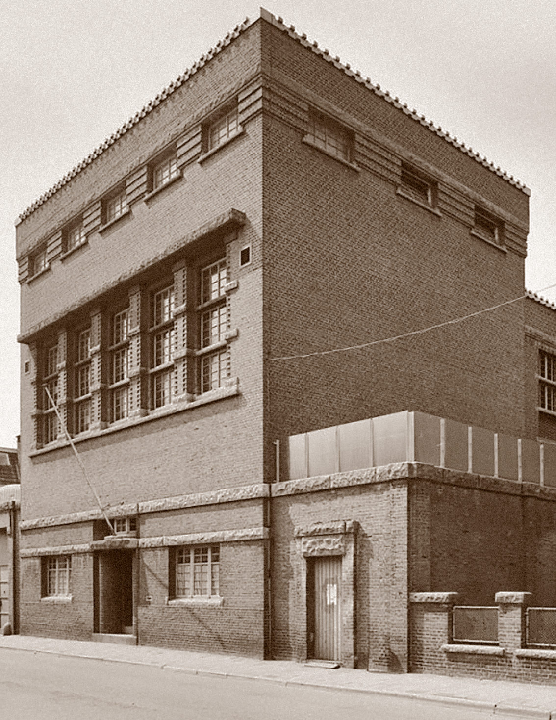
Huis van Bewaring - Almelo