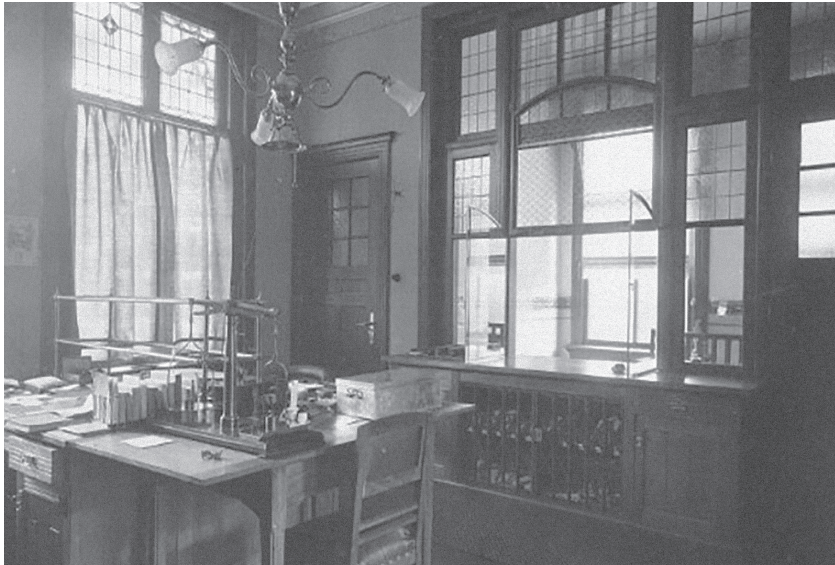
Kantoor met balie en daarachter de wachtruimte

Bij die laatste woorden maakte hij met zijn rechterduim en wijsvinger het symbool van een pistool en pakte in dezelfde beweging de hoek van het vel papier dat hij weer onder het glas door naar zich toe trok. Het verdween in zijn binnenzak. Met een ‘dank u wel en nog een goede dag’ nam hij afscheid.