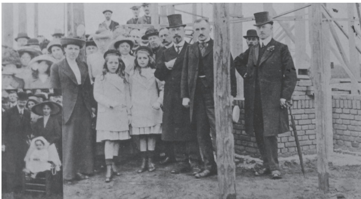
Afb. 5: De eerste steenlegging van de stichtingen der Gereformeerde Vereeniging tot duurzame verzorging van minderjarigen te Achterveld bij Amersfoort.

'De 28ste juni 1913 was een feestdag voor de vereniging. Het bestuur en enkele belangstellenden waren op 't terrein van het opvoedingsdorp De Glindhorst verenigd. Nadat de kleine jonkvrouw den eersten steen keurig had gelegd, nam zij dapper het woord, en zei ongeveer aldus: "Nu is mijn werk af, en ik hoop, dat er nog vele steenen op dezen zullen gebouwd worden. En als het huis klaar is, dan hoop ik, dat allen die er in zullen komen, zich er gelukkig zullen gevoelen." Een traan sprong in veler oog bij die ongekunstelde woorden.