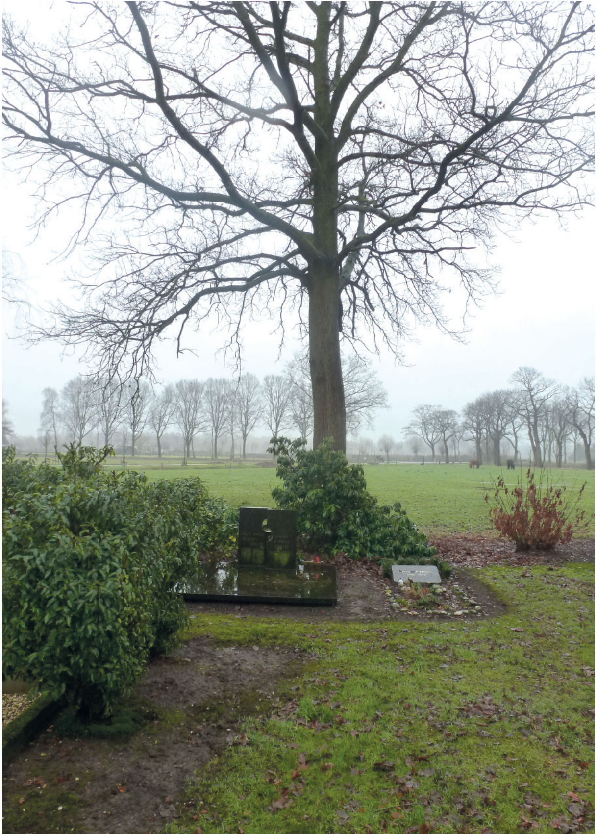
Afb. 6: Laatste rustplaats Freddy Rudolph Dorland, begraafplaats De Glind.