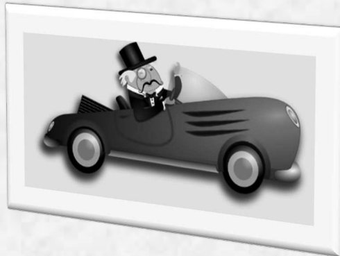
3. Alpha Romeo