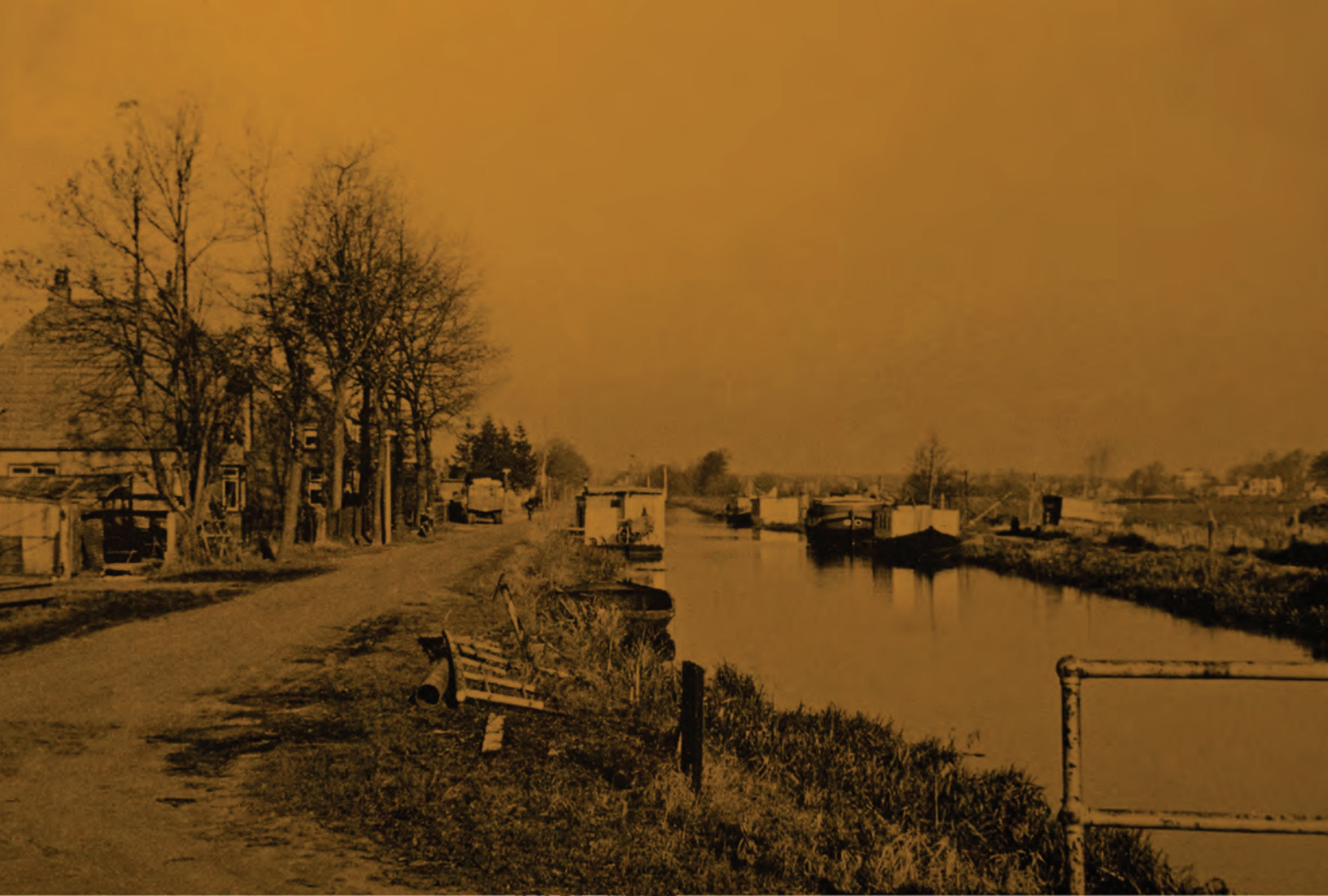
Gezien vanaf „het Hoekie” — Hollandsche Veld.