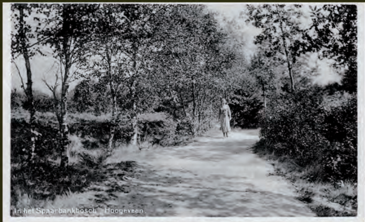
In het Spaarbankbosch. Hoogeveen.