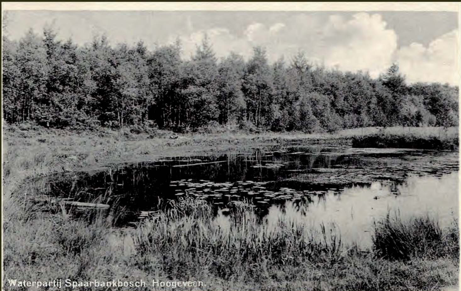
Waterpartij Spaarbankbosch. Hoogeveen.