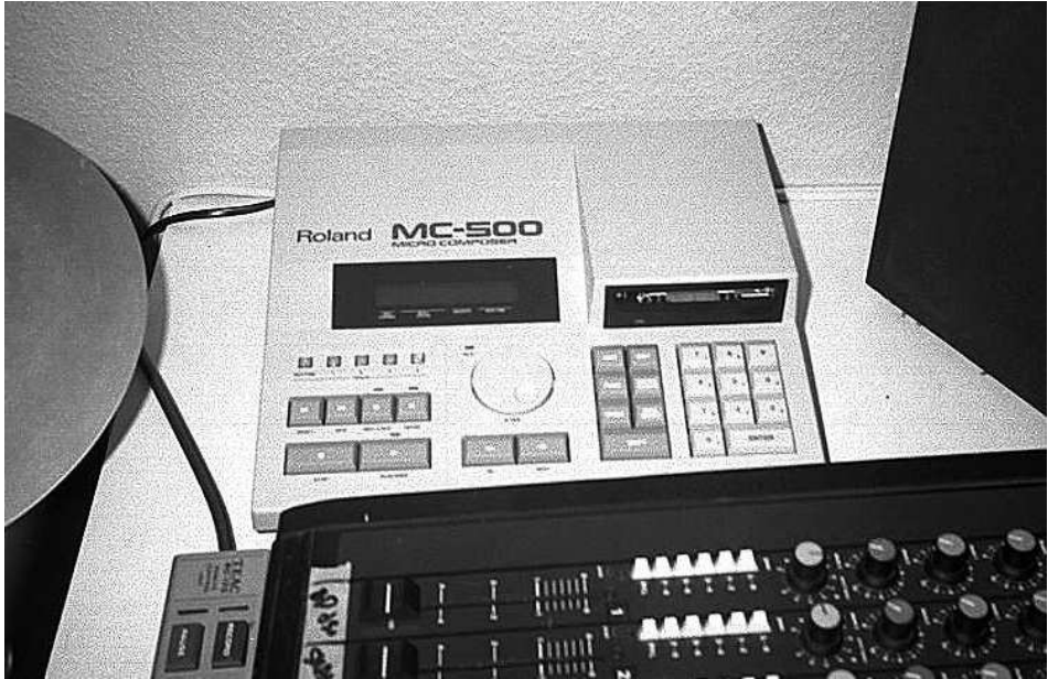
De Roland MC-500 sampler, door Peter ook wel 'kassa' genoemd