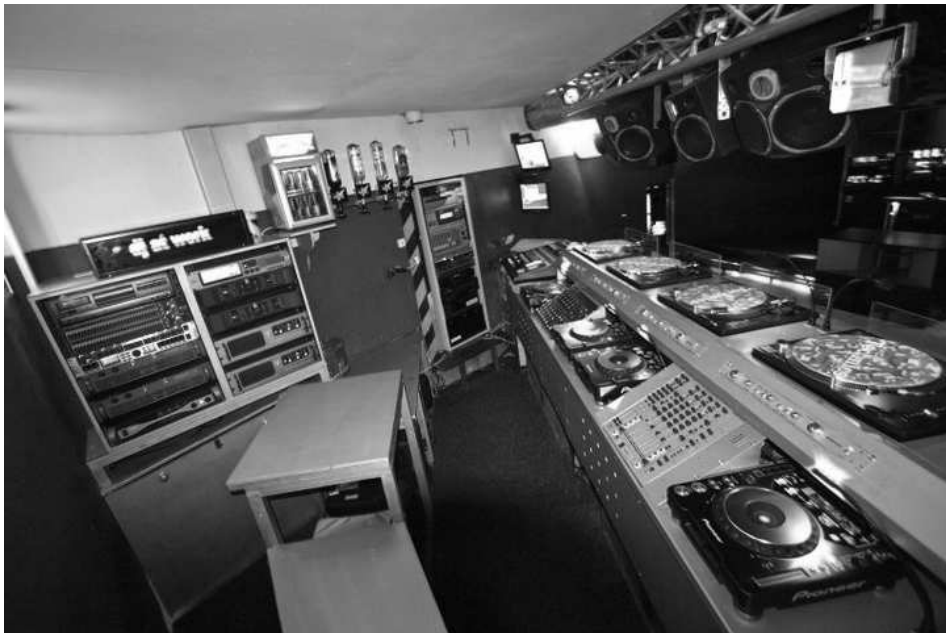
De DJ-booth van Club Revolution in beeld