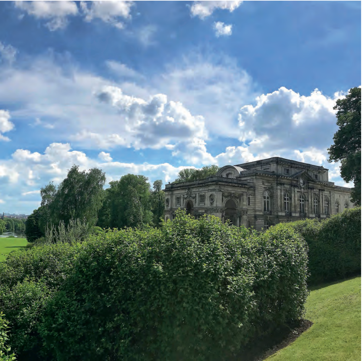
Castle of Laeken — Château de Laeken — Kasteel van Laken — Schloss zu Laeken