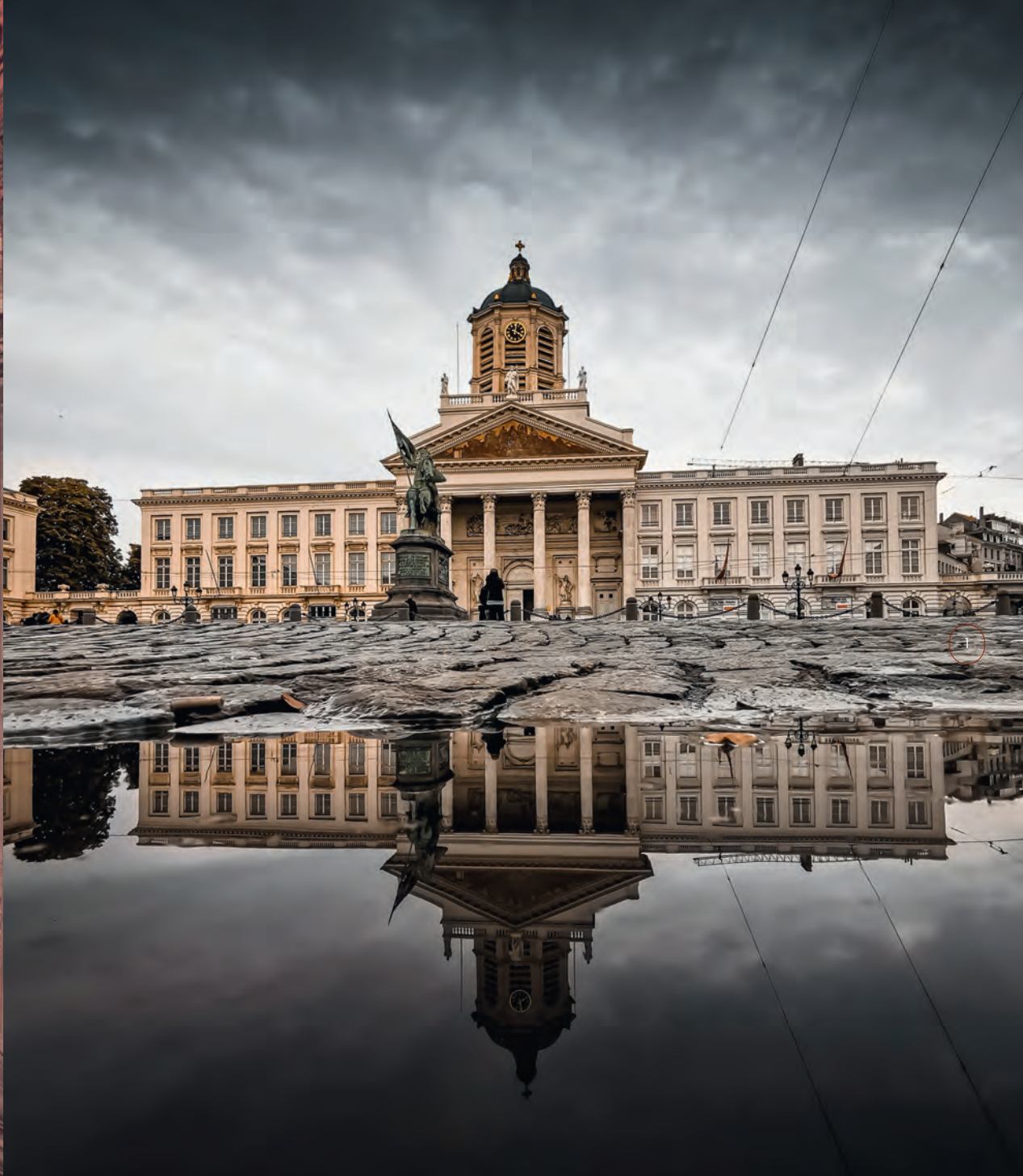
Place Royale, Brussels – Place Royale, Bruxelles – Koningsplein, Brussel – Königsplatz, Brüssel