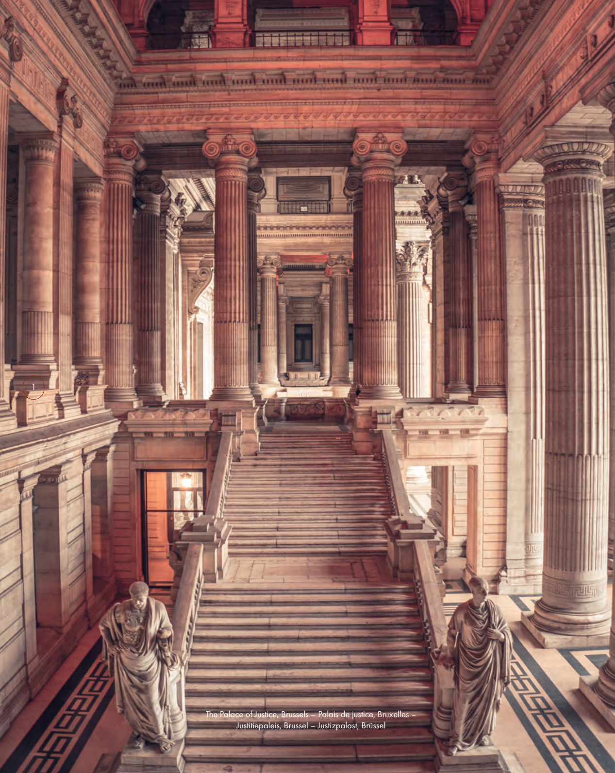
The Palace of Justice, Brussels – Palais de justice, Bruxelles – Justitiiepaleis, Brussel – Justizpalast, Brüssel