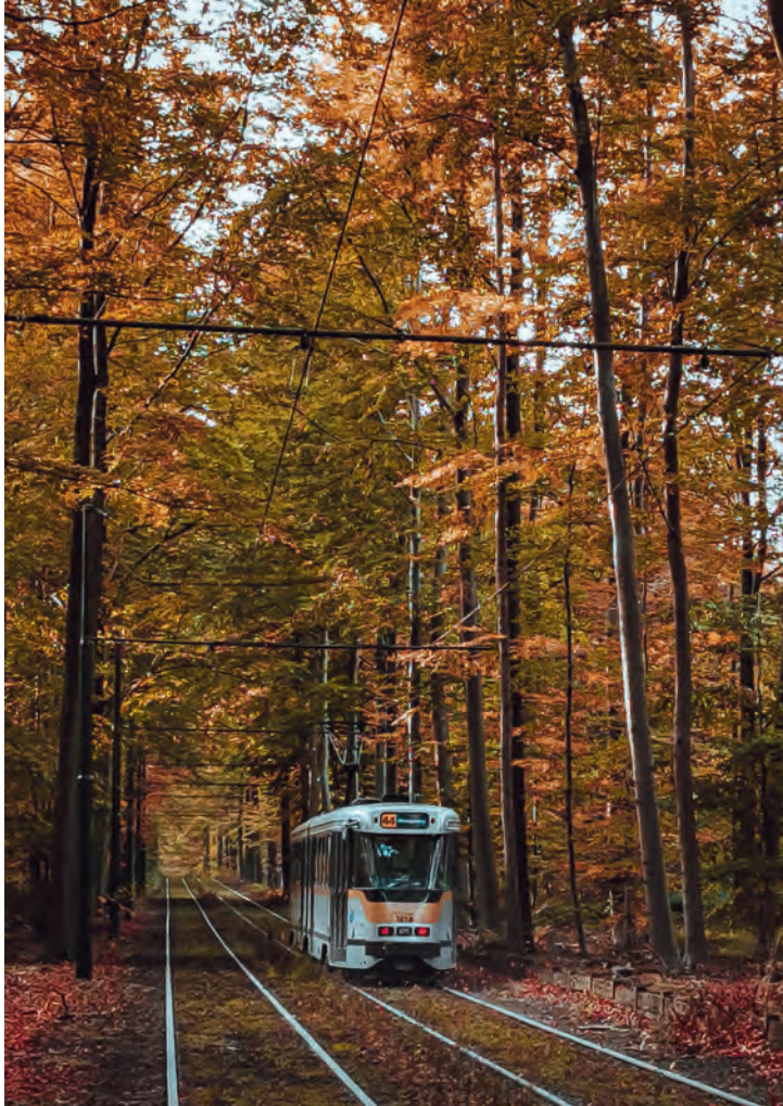
The Sonian Forest, Tervuren – Forêt de Soignes, Tervuren – Zoniënwoud, Tervuren – Sonienwald, Tervuren