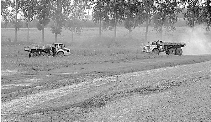
Vernietiging van vruchtbare akkers in de Hedwige.

Met de mogelijkheden om voedsel te produceren wordt zeer roekeloos omgesprongen. “Dat moet stoppen”, vindt de WFP.