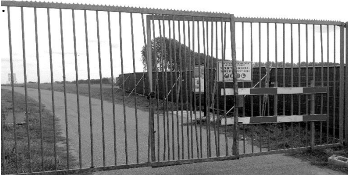
Hedwigepolder hermetisch op slot.

Begrijpelijk, want hij is de man die is buitengesloten. Na alles wat hij voor de hertogin heeft gedaan. Zichtbaar gemaakt met deze foeilelijke ijzeren afgrenzing.