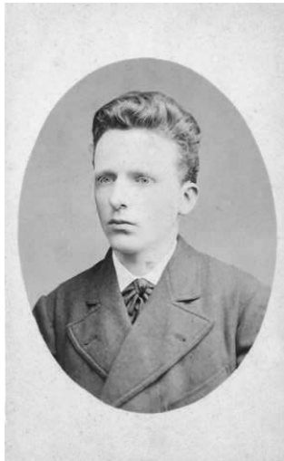
Theo van Gogh in 1876 op 19-jarige leeftijd

“ ‘t Is een mooie stad hier”, schreef Vincent. Zijn openhartige brieven aan zijn jongere broer Theo over de mensen in zijn omgeving, de gebouwen in de stad en de rijkdom van kunst vormen het uitgangspunt voor dit fotoboek. De fotograaf is op dezelfde plek gaan staan waar vroeger, vaak meer dan een eeuw geleden, iemand gegrepen werd door een bepaald gebouw of straat in Amsterdam.