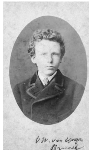
Vincent op 15-jarige leeftijd in Parijs, 1866

A= nummer op de betreffende plattegrond. B= coördinaten opnamepositie of object. C= paginanummer foto grootformaat historische foto. D= historische foto. E= opnamejaar historische foto. F= paginanummer foto grootformaat actuele foto. G= actuele foto. H= huidige adres.