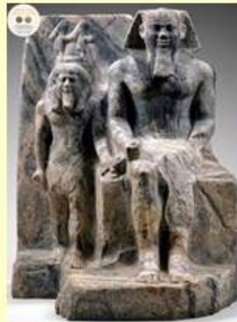
Koning Sahu-re uit de 5e dynastie is hier afgebeeld met de vergoddelijkte Nomos van Harawî. Het beeld is gemaakt van Gneis en is gevonden in Koptos. Het is nu in het Met. Museum in New-York