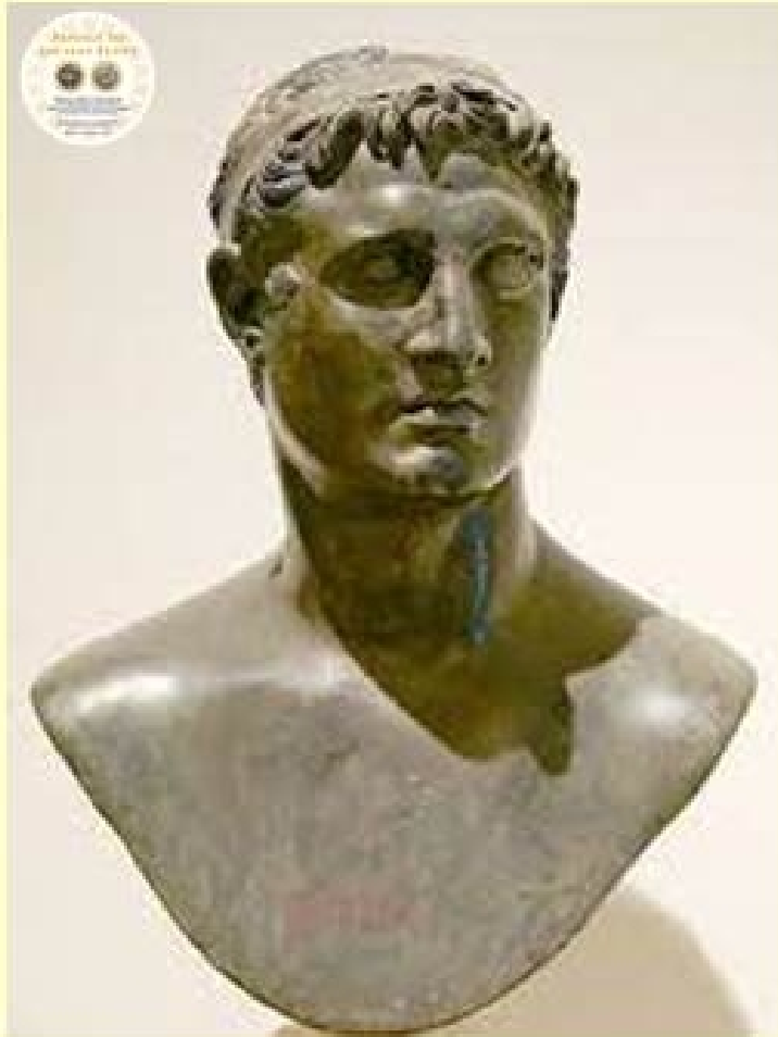
Ptolemy II Philadelphus

Stad en begraafplaatsen zijn vandaag zwaar verwoest. De grote tempel was oorspronkelijk gewijd aan Min. In latere tijden was de tempel gewijd aan Min en Isis, zij was de echtgenote van Min in Koptos. De tempel werd onder Ptolemaeus II sterk vergroot.