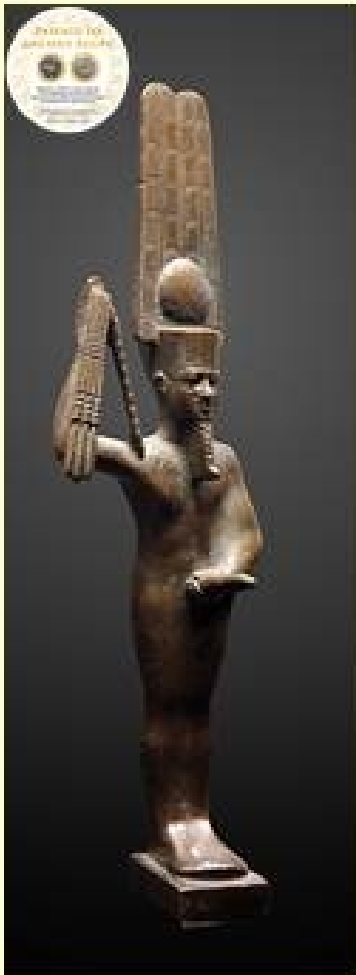
Amun-Min Kamutef –Gebtu. Na zijn samensmelting met Amun. Maar als Min bleef hij de god van Koptos en de Wady Hammamat.

De stad, die een belangrijk landbouwbekken had, had ook een haven aan de Nijl die was gebouwd aan de uitmondingen van de hoofdwegen die naar Wady Hammamât leidden, wegen die ook toegang gaven tot minerale afzettingen, 4000 jaar lang was de stad een bloeiend economisch centrum.