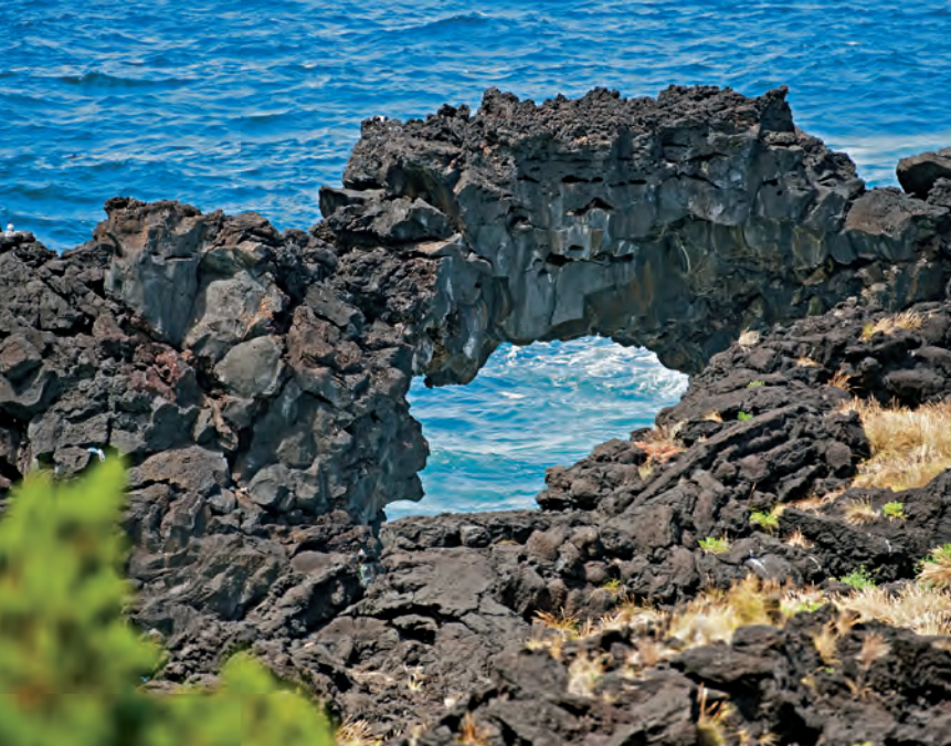
Rotsboog in Fajã da Ribeira da Areia.

passeren we een kruisbeeld en komen vlak daarna uit het bos. Hier slaan we rechtsaf. Bij een huis met een Madonna-afbeelding komen we uiteindelijk op de weg en lopen daarop links verder naar het kerkje Ermida de Nossa Senhora da Fátima (45 minuten). Daarachter eindigt ook de weg midden in het centrum van de sinds 1980 grotendeels opgegeven Fajã da Ribeira da Areia (4). Honderd jaar geleden nog leefden hier rond 500 mensen permanent. We lopen links verder op de Caminho do Arco, slaan na 75 m rechtsaf op een veldweg en komen zo bij de kust, waar interessante rotsformaties en een rotsboog zijn ontstaan. Hier gaat het nu met de klok mee steeds verder en uiteindelijk komen we weer terug op de splitsing onder de kapel. Op de weg lopen we nu gemakkelijk naar boven en later op de heenweg terug naar het uitgangspunt (1).