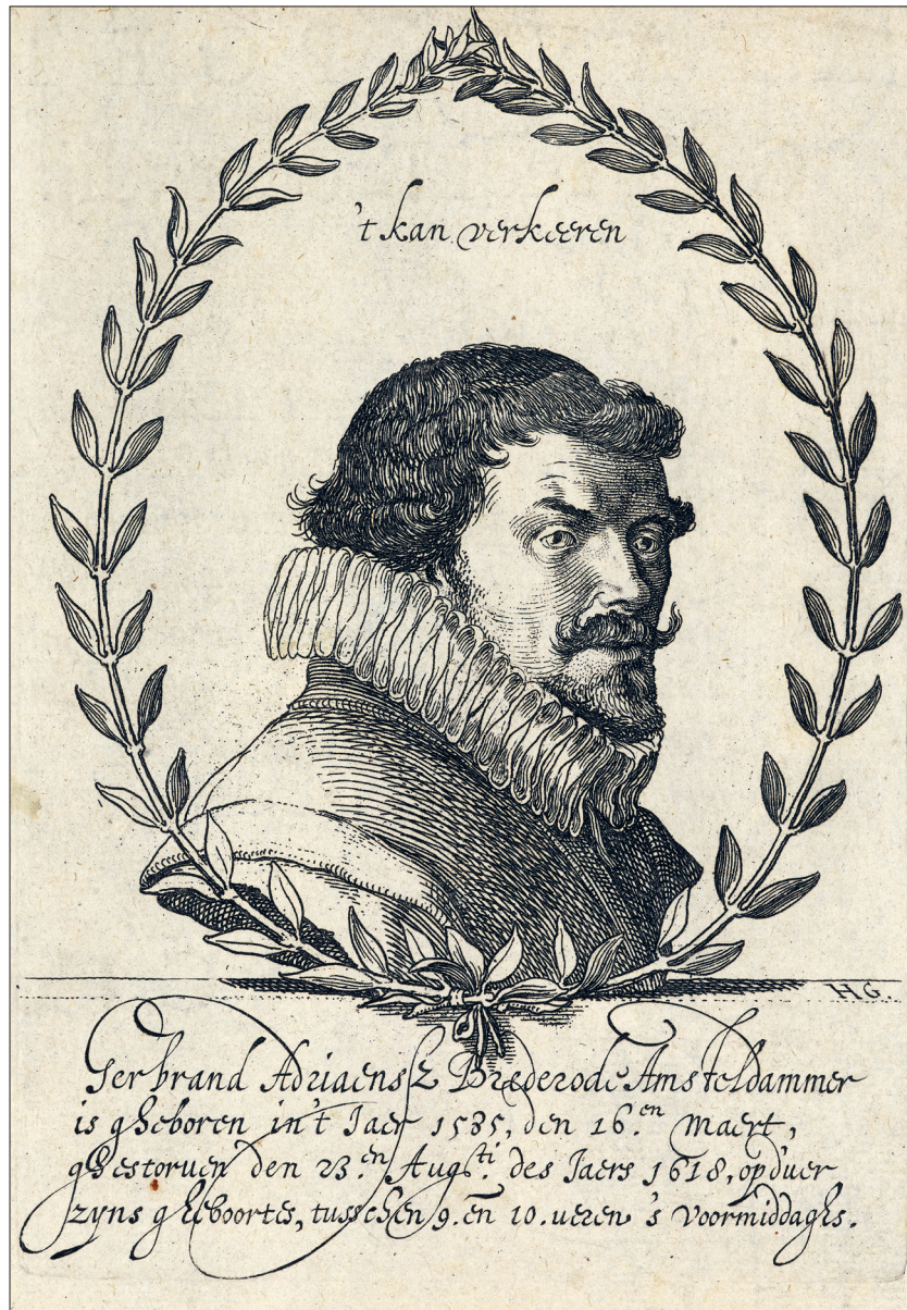
Bij de 'Lijk-dichten' verscheen een portretgravure van Bredero, gekaderd in een lauwerkrans, van oudsher het hoogste eerbetoon aan een dichter. Eronder stond een bij-schrift met precies die informatie die de vader van Bredero ook in zijn Livius had aangekend: 'Gerbrand Adriaensz Brederode Amsteldammer is geboren in 't Jaer 1585, den 16. en maert, gestorven den 23. en Augusti des Jaers 1618, op d'uer zyns gheboorts, tusschen 9 en 10 uren 's voormiddaghs.'