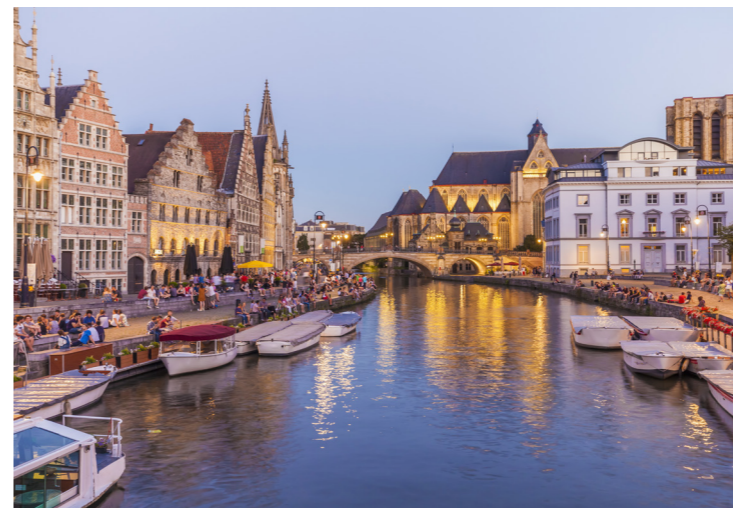
Historische huizen aan de Korenlei en de Graslei in Gent

Het Thames Path National Trail is een 294 km lang wandelpad dat de rivier volgt vanaf de bron tot aan de Thames Barrier in Oost-Londen – of andersom dus. Reken op maximaal twee weken voor een onvergetelijke ervaring.