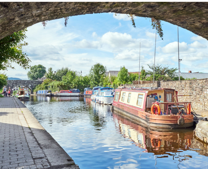
Schepen op het Monmouthshire & Brecon Canal

Het uit het einde van de 19e eeuw stammende Monmouthshire & Brecon Canal zoekt zich een weg door het spectaculaire Brecon Beacons National Park en vormt een zalige manier om de mooiste landschappen van Wales te bekijken. Dat gaat het best per boot. Je tocht begint bij de rustige Goytre Wharf, een voormalig industrieel centrum met een aantal historische kalkovens, waarna het in noordelijke richting naar Brecon gaat. Terwijl je over het kalme water van dit lommerrijke kanaal schuift, laat je alle drukte achter je en betreed je een vredig landschap. Rond Llangattock en Talybont-on-Usk doemen de bolle heuvels van de Brecon Beacons op en dat levert wat obstakels op: terwijl je Brecon nadert moet je vijf sluizen langs die allemaal handmatig worden bediend. Gelukkig wordt dit harde werk na afloop goed beloond met een hartige Welsh rarebit met uienringen en cheddar in een van de vele charmante pubs van de stad.