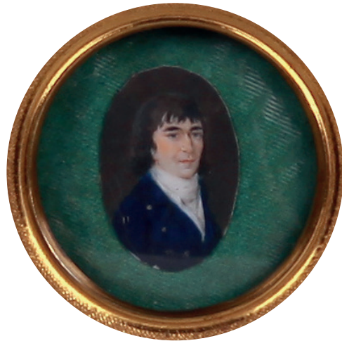
► Vroegste portret van Bilderdijk, door onbekende kunstenaar, waterverf op ivoor, circa 1780.