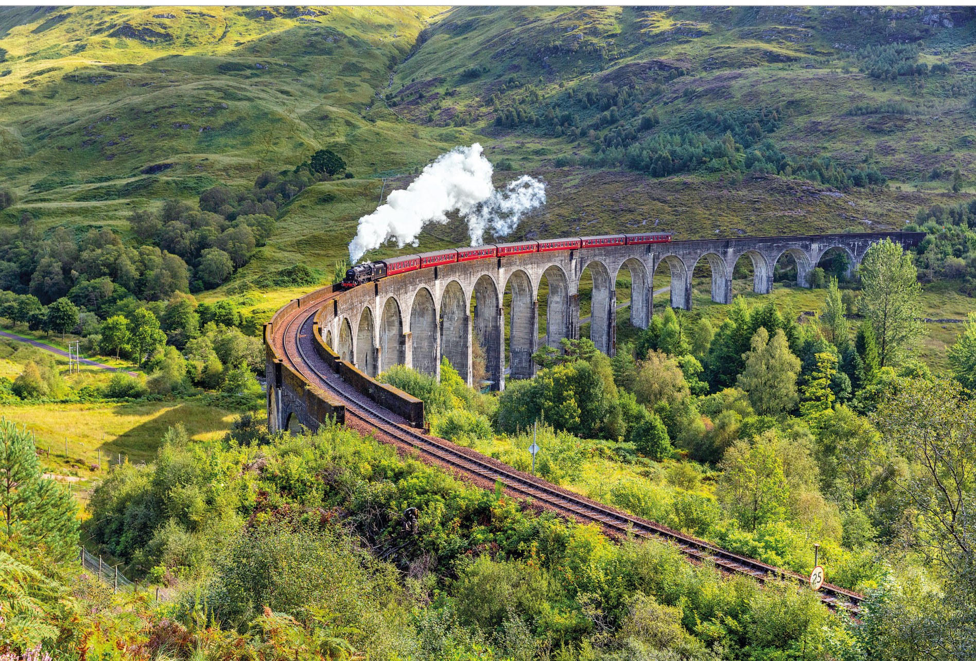
82-83 – Getrokken door een stoomlocomotief passeert de Jacobite het bekende Glenfinnan Viaduct op de Schotse West Highland Line tussen Fort William en Mallaig.

Vertretpunt: Fort William Eindpunt: Mallaig Afstand: 68 km Reistijd: 4 uur (terugrit 's ochtends), 6 uur (terugrit 's middags) Etappes: 1 Ligging: Schotland