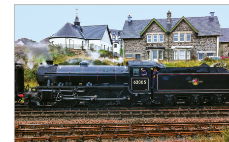
83 – De K1-klasse stoomlocomotief 62005 voor de Jacobite, klaar om het station van Mallaig te verlaten.