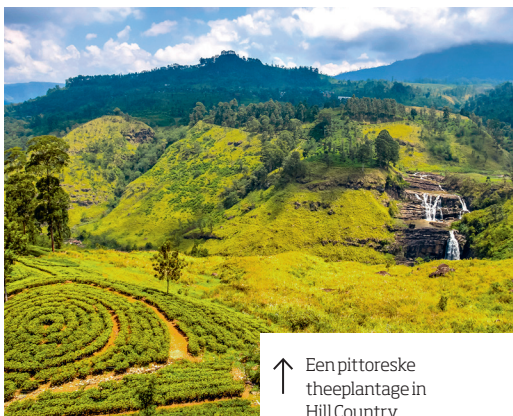
↑ Een pittoreske theeplantage in Hill Country